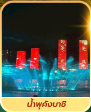
น้ำพุคังบาซี