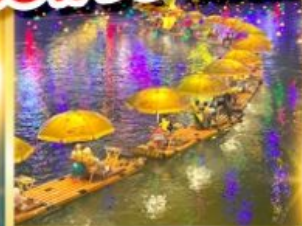
ล่องแพมังกร