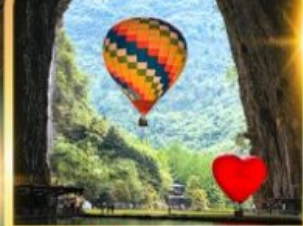
ท่าเกิงหลง