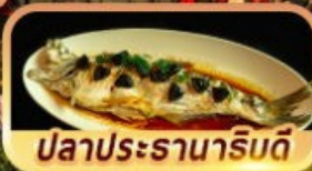
ปลาประรานาภิบัติ