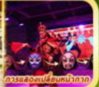
การแสดงเปลี่ยนหน้ากาก