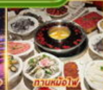
ถ้ำหนั่งโงไฟ