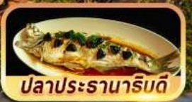
ปลาประรานาภิรมดี