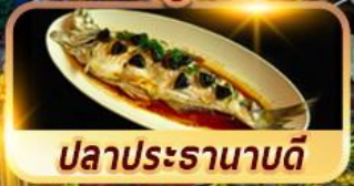
ปลาประรานาบดี