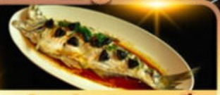
ปลาประรานาบดี