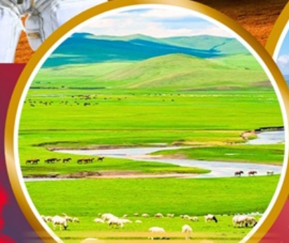
ทุ่งหญ้าออร์โดส

พิเศษ!!! สวมชุดของโกเลีย บนกระโหลกของโกเลีย