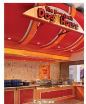
The Dog House DOG HOUSE