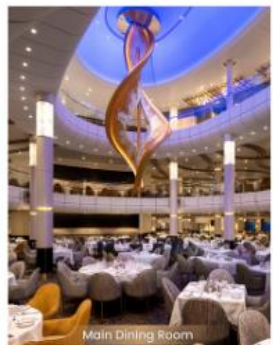
Main Dining Room MAIN DINING ROOM