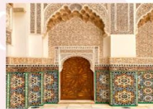
Ben Youssef Medersa