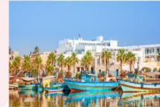
เมืองฮัมมาเมต

** พักที่ Radisson Blu Hammamet Hotel 5* หรือเทียบเท่า **