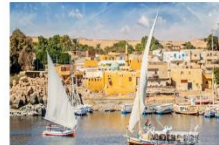
Option ล่องเรือเฟลกะ หรือ ล่องเรือชมหมู่บ้าน Nubian Village

** พักที่ Royal Beau Rivage Nile cruise 5* หรือเทียบเท่า **