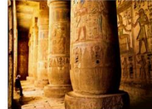
วิหารมาดินัตฮาบู

** พักที่ Royal Beau Rivage Nile cruise 5* หรือเทียบเท่า **