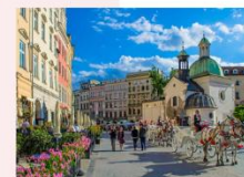
เมืองคราคูฟ

** พักที่ Golden Tulip Krakow Kazimierz Hotel 4* หรือเทียบเท่า **