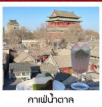
คาเฟ่ น้ำตาล