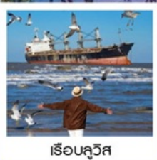
เรือลิวอิส