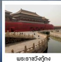
พระราชวังกรุงปักกิ่ง