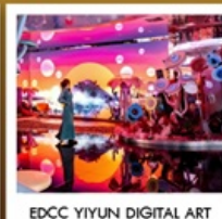
EDCC YIYUN DIGITAL ART