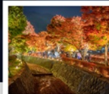
อุโมงค์เมบิล