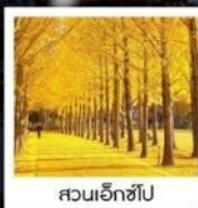
สวนเอ็กซ์โป