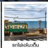
รถไฟเอโนะเด้น