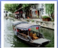
เมืองโบราณหนานสวิน