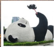
รูปปั้นหมีแพนด้าชงชี่