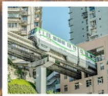
รถไฟฟ้าคุตัก