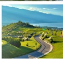
กุาฮวี่ยนเซียงซาน