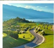
กุขาววินเซียงซาน