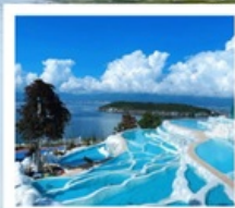
ซานโตรินี่ต้าหลี่

“เกาะเสี้ยวผู่...เกาะลึกลับกลางทะเลสาบ เอ้อไห้”