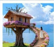
หมู่บ้านเหวินปี้