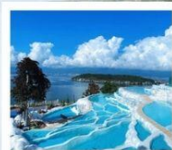
ซานโตรินี่ต้าหลี่