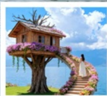
หมู่บ้านเหวินปี้

เมืองโบราณต้าหลี่ / นั่งเรือสู่เกาะเสี้ยวผู่ / ซานโตรินี่ (รวมรถแบบเตอร์) / ถนนทางแอร์ต้าต้า / กุาฮวี่ยนเซียงซาน / ต้าซ่าท่าเรือหลงกัน โค้ง S ทะเลสาบเอ้อไห้ / หมู่บ้านโบราณสี่จิว / หมู่บ้านเหวินปี้ / ชมดอกไม้ตามฤดูกาล