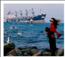
เรือบลูวิส

หอคอยกาลเวลา / รูปปั้นปลาวาฬ / ถนนโบราณเตาหยาง / ย่านสงโขว่ 1920 / เมืองเว่ยไห่ / ถนนฮั่วจวิปา / จตุรัสประตูแห่งความสุข ย่านอันลอฟาง / เรือบลูวิส / หาดซาจื่อโซ่ว / ถนนหลงเจียง / สะพานจันเจียว / หาดไซเบอร์ No. 3 ถนนจงซาน / โบสถ์ St.Emill / จตุรัส 54 / ศูนย์เรือใบโอลิมปิก / พิพิธภัณฑ์มิสเตอร์ชิงเต่า / ถนนโตตง / ท่าเรือประมงเหยียนโก