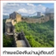
กำแพงเมืองจีนด่านมู่เทียนยวี่