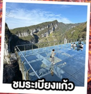
ชมระเบียบแก้ว