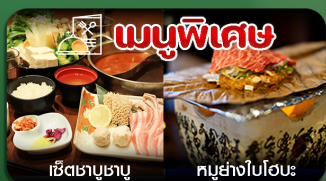
เชิตซาบูซาบู คุปย่างไปโอะะ

โซาก้า-ฮาคุบะ-คาเฟ่city bakery-นั่งกระเช้าชมวิว-ปราสาทโทยาม่า-ชมงานประดับไฟ-ชิราคาวะโกะ-ซ้อมปิ้งชินไซบาชิ-เที่ยวเต็มไม่มีอิสระ