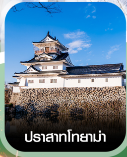
ปราสาทโทยาม่า