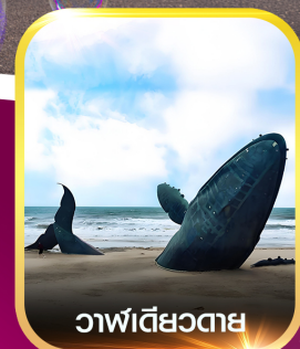
วาฬเดี่ยวตาย

✈️ คอนเฟิร์ม ออกเดินทาง ✈️ ทุกพีเรียด 2 ท่านขึ้นไป