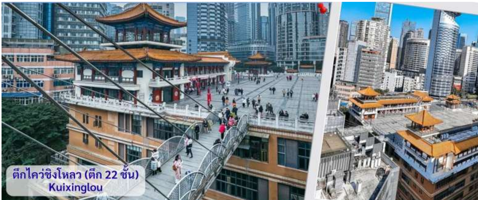
ตึกไควชิงโหลว (ตึก 22 ชั้น) Kuixinglou

จากนั้นอิสระถ่ายรูปหน้าตึกตะเกียบ ฉงชิ่ง(ด้านนอก) คือ ฉงชิ่งกั๋วไท่อาร์ตเซ็นเตอร์ (Chongqing Guotai Arts Center) เป็นแลนด์มาร์กสำคัญที่มีสถาปัตยกรรมคล้ายตะเกียบยักซ์สีแดงและดำวางซ้อนกัน เป็นศูนย์จัดแสดงงานศิลปะและสถานที่ท่องเที่ยวที่นิยมสำหรับการถ่ายรูป โดยเฉพาะในเวลากลางวันเมื่อเปิดไฟสวยงาม สิ่งก่อสร้างอันมีเอกลักษณ์ อาคารนี้ถูกวางโครงสร้างให้มีรูปร่างคล้ายกอง "ตะเกียบยักซ์" สีดำและแดงที่วางซ้อนกันเป็นชั้นๆ ที่ส่วนปลายของตะเกียบสีแดงจะมีตัวอักษรจีนคำว่า "กั๋ว" ประทับอยู่ ซึ่งมีความหมายถึง ชาติหรือประเทศ ส่วนที่ปลายตะเกียบสีดำ จะมีอักษรจีนคำว่า "ไท่" ประทับอยู่ ซึ่งหมายถึง ความเจียบสงบ หรือความอุดมสมบูรณ์