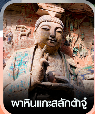
พาคินแกะสลักตัวจู้