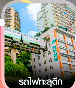
รถไฟทะเลสาบ

✈️ คอนเฟิร์มออกเดินทาง ทุกพีเรียด 2 ท่านขึ้นไป