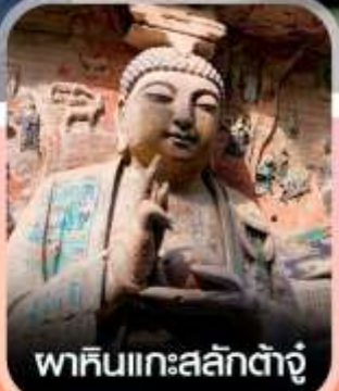
พาคินแกะสลักต้ำจู้