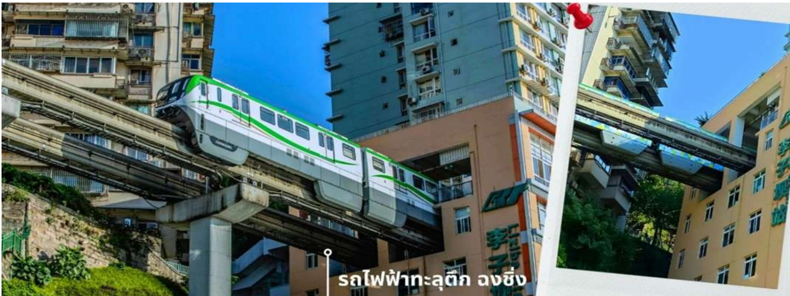
รถไฟฟ้าทะเลตุ๊ก ลงชิง

จากนั้นนำท่านนั่งรถไฟฟ้าทะเลตุ๊ก หรือ สถานี Liziba เป็นสถานีรถไฟฟ้าแบบชานชาลา สิ่งที่ทำให้สถานี Liziba มีชื่อเสียงไปทั่วโลกคือ “เส้นทางรถไฟที่วิ่งทะลุผ่านอาคารสูง 19 ชั้น” โดยมีระบบลดเสียงและแรงสั่นสะเทือน ทำให้ผู้ที่อาศัยอยู่ในตึกไม่ได้รับผลกระทบจากเสียงดังมาก กลายเป็นภาพอันน่าตื่นตาตื่นใจของผู้ที่มาเยือนทั้งนักท่องเที่ยวที่เดินทางมาเป็นครั้งแรก ผู้โดยสารบนขบวนรถไฟและผู้เข้าชมจากจุดชมวิวที่ต่างตื่นตันทึ่งไปตามๆกันกับการที่ได้เห็นรถไฟวิ่งทะลุตึกนี้ สถานี Liziba ได้รับการยกย่องให้เป็น 1 ในสถานที่สำคัญที่สะท้อนความเติบโตของจีนตลอด 70 ปี ซึ่งไม่ได้เกิดขึ้นโดยบังเอิญ รถไฟฟ้าทะเลตุ๊กนี้คือตัวอย่างของความอัจฉริยะในการออกแบบการคมนาคมในเมืองภูเขาแห่งนี้ให้ท่านได้สัมผัสประสบการณ์กับการขึ้นนั่งบนรถไฟเพื่อผ่านทะเลตุ๊กและเก็บภาพบรรยากาศ