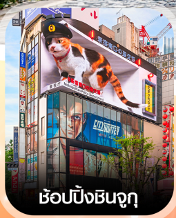
ซ้อปิ้งชินจูกุ