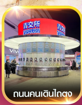
ถนนคนเดินโกตง