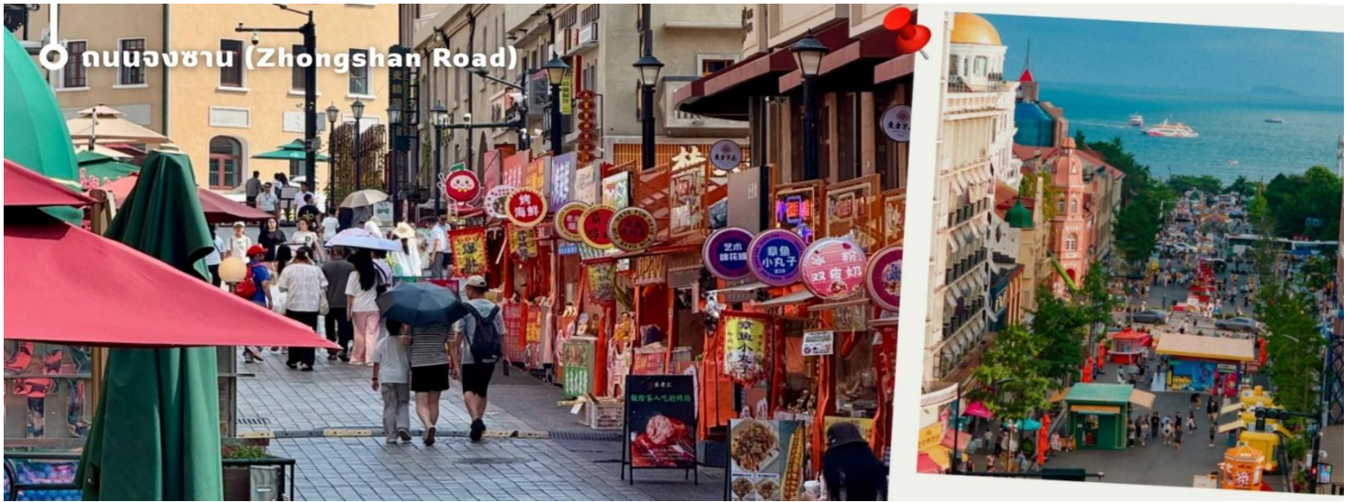
ถนนจงซาน (Zhongshan Road)

และเก็บความประทับใจท่ามกลางเมืองท่าริมทะเลที่มีเสน่ห์แห่งนี้ นับเป็นอีกหนึ่งจุดหมายยอดนิยมที่ไม่ควรพลาดเมื่อมาเยือนเมืองชิงเต่า