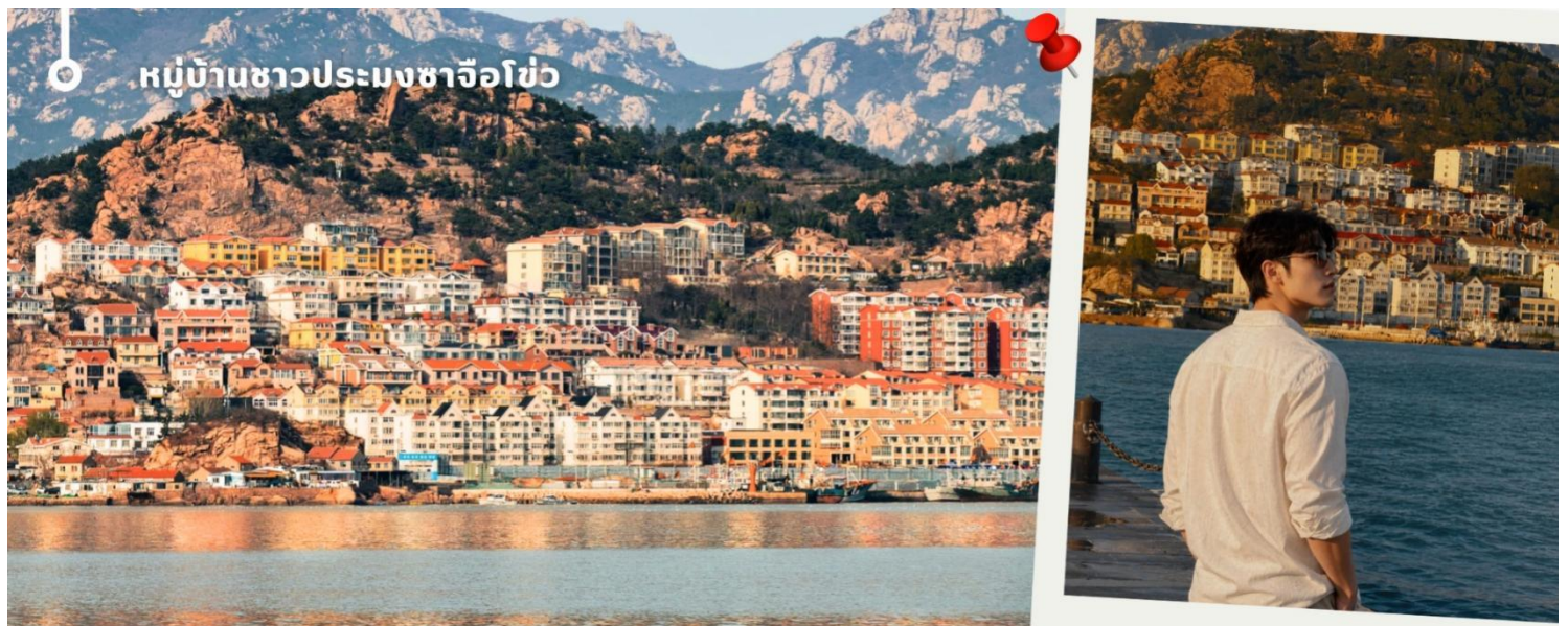
หมู่บ้านชาวประมงซาจื่อโข่ว

นำท่านสู่ หมู่บ้านชาวประมงซาจื่อโข่ว (Shazikou) หมู่บ้านชาวประมงเก่าแก่ริมชายฝั่งชิงเต่า ตั้งอยู่บริเวณเชิงเขาเหลาซาน โดดเด่นด้วยบ้านเรือนสีส้มสดใสที่เรียงรายลดหลั่นไปตามไหล่เขา ตัดกับท้องทะเลสีครามและภูเขาอันงดงาม จนได้รับฉายาว่าเป็น “หมู่บ้านริมทะเลสไตล์ยุโรป” สัมผัสวิถีชีวิตชุมชนชาวประมงดั้งเดิม ชมทัศนียภาพอันเจียบสงบของภูเขาและทะเล พร้อมเลือกซื้ออาหารทะเลสดใหม่ และเก็บภาพความประทับใจกับหนึ่งในแลนด์มาร์กยอดนิยมของชิงเต่า