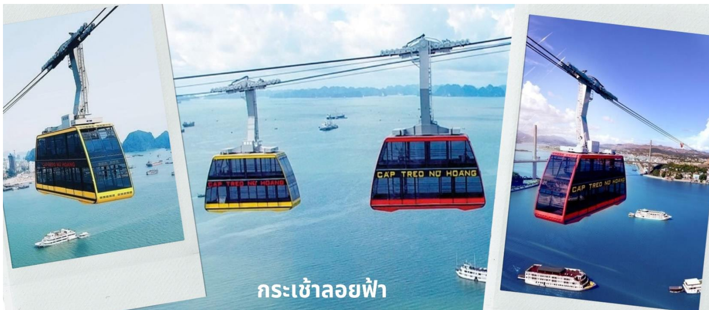
กระเช้าลอยฟ้า

จากนั้นนำท่านนั่ง Queen Cable Car กระเช้าลอยฟ้า 2 ชั้นที่ใหญ่ที่สุดในโลก จุคนได้มากถึง 250 คนต่อเที่ยว สามารถรับ-ส่งผู้โดยสารได้มากถึง 2,000 คนต่อชั่วโมง กระเช้าลอยฟ้า 2 ชั้นยิ่งใหญ่อลังการนี้เป็นส่วนหนึ่งของสวนสนุก Sun World Halong Park สร้างโดย Doppelmayr/Garaventa Group จากประเทศสวิตเซอร์แลนด์และออสเตรเลีย โดยมีความพิเศษที่สามารถทำลายสถิติโลก และได้รับการบันทึกลงใน Guinness World Records ถึง 2 รายการ คือ เป็นกระเช้าที่จุคนได้มากที่สุดในโลก และมีเสาคอนกรีตส่งกระเช้าที่สูงที่สุดในโลก ด้วยความสูงถึง 188.88 เมตร