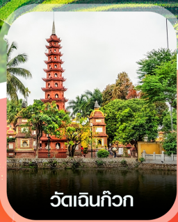
วัดอินทก๊วก

✈️ คอนเฟิร์มออกเดินทาง ทุกพีเรียด 2 ท่านขึ้นไป