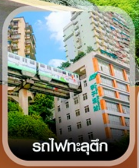
รถไฟทะลุติ๊ก

✈️ คอนเฟิร์มออกเดินทาง ทุกพีเรียด 2 ท่านขึ้นไป