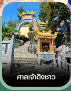
ศาลเจ้าดิ้งเซา