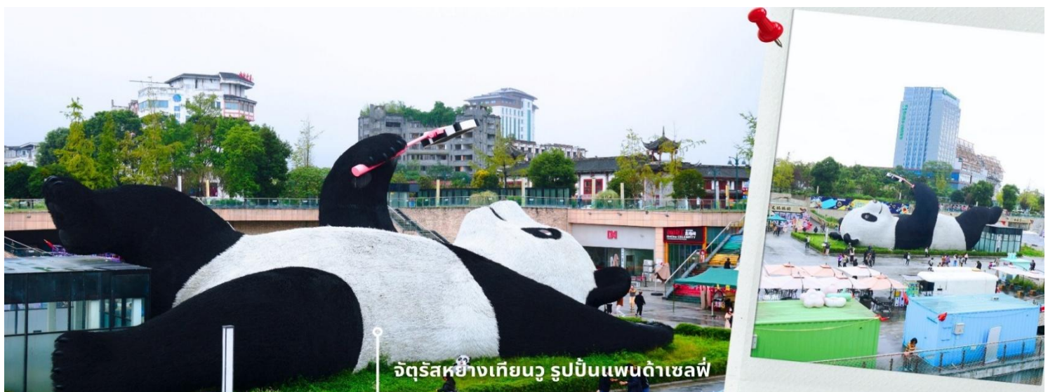
จัตุรัสหย่างเทียนวู รูปปั้นแพนด้าเซลฟี่

นำท่านเที่ยวชม จัตุรัสหย่างเทียนวู เป็นจุดเช็คอินที่สำคัญสำหรับคนที่มาเที่ยวที่ เมืองตูเจียงเยียน บริเวณจุดตัดท่าข้ามอำเภอตูเจียงเยียน นครเฉิงตู ไฮไลท์ของจัตุรัสหย่างเทียนวู คือ ประติมากรรม แพนด้ายักษ์ที่กำลังนอนหงายท้อง ยื่นมือถือไม้เซลฟี่สีชมพู ซึ่งออกแบบโดยนักออกแบบชื่อดัง Florentijn Hofman รูปปั้นแพนด้า ยักษ์มีความยาว 26 เมตร กว้าง 11 เมตร สูง 12 เมตร และหนัก 130 ตัน แบบท่าทางสบายๆของแพนด้าที่ความประทับใจและรอยยิ้มให้กับผู้ที่มาเยือนจัตุรัสหย่างเทียนวู สามารถดึงดูดนักท่องเที่ยวได้เป็นจำนวนมากเลยทีเดียว เป็นการแสดงออกด้วยภาษาทางศิลปะแบบหนึ่งที่สะท้อนชีวิตในท้องถิ่น มอบความรู้สึกสนิทสนมและมีความสุขกับผู้ชม อิสระเดินชมถ่ายภาพ รูปปั้นแพนด้าเซลฟี่ ตามอัยาศัย ที่นึ่งเป็นจุดเช็คอินที่เหมาะสมสำหรับทุกเพศทุกวัย หากคุณกำลังมองหาสถานที่ท่องเที่ยวใหม่ๆ ที่เต็มไปด้วย ความทรงจำดีๆ จตุรัสหย่างเทียนวู คือคำตอบที่สมบูรณ์แบบ