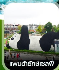
แพนด้ายักษ์เซลฟ์

✈️ คอนเฟิร์ม ออกเดินทาง ทุกพีเรียด 2 ท่านขึ้นไป