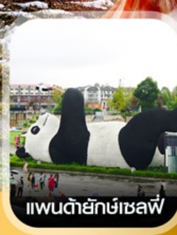
แพนด้ายักษ์เซลฟ์

✈️ คอนเฟิร์มออกเดินทาง ✈️ ทุกพีเรียด 2 ท่านขึ้นไป