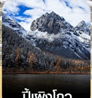
ปีเพิงโกว