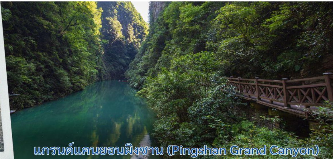
แกรนด์แคนยอนผิงซาน (Pingshan Grand Canyon)

เที่ยง รับประทานอาหารกลางวัน ณ ภัตตาคาร (6)