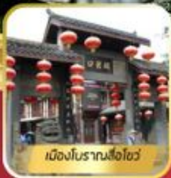
เมืองโบราณล่อซื่อ