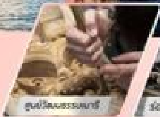
ชมวิถีชนชาวเมารี