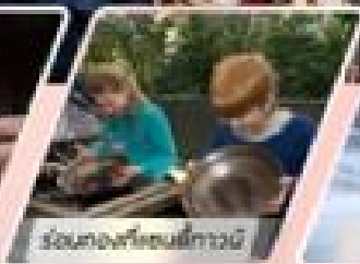
ร่วมเล่นกีตาร์เมารี