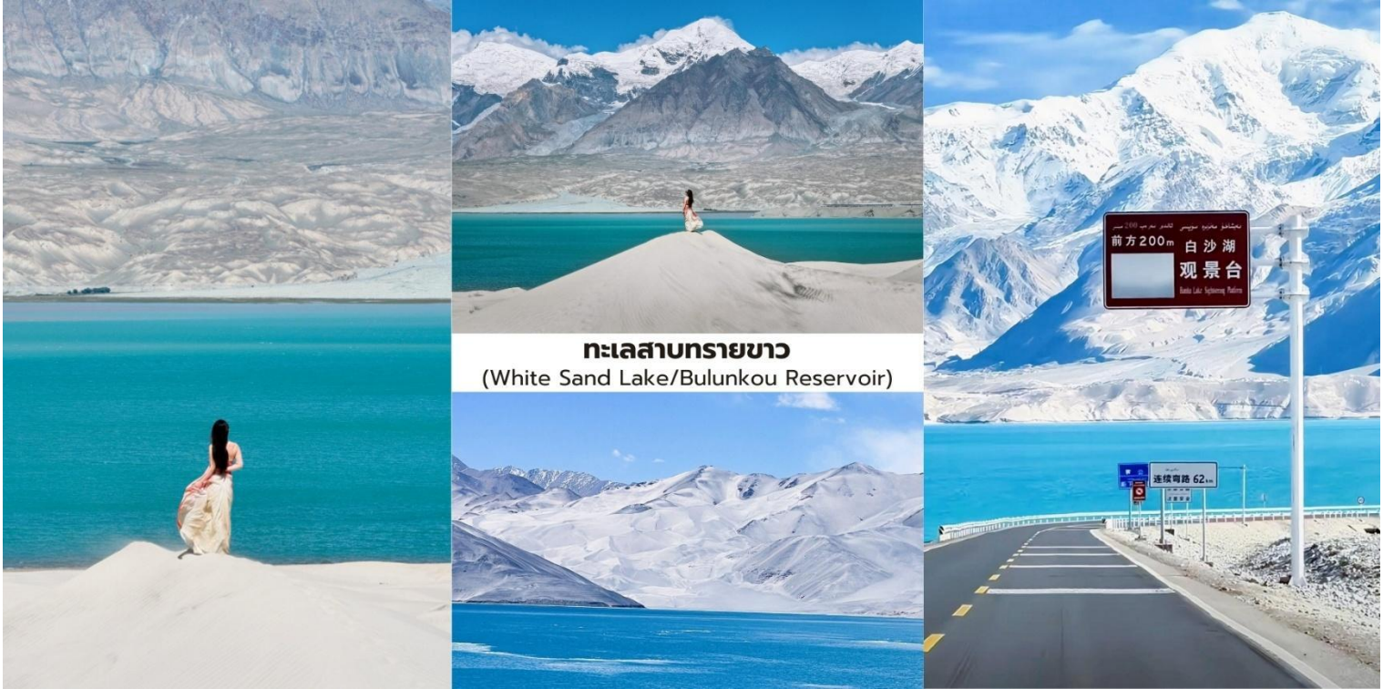
ทะเลสาบทรายขาว (White Sand Lake/Bulunkou Reservoir)

เป็นหนึ่งในจุดถ่ายภาพที่มีชื่อเสียงของเส้นทางสายปามิร์ ทิวทัศน์บริเวณนี้ยังมีฉากหลังเป็น ยอดเขาคองกูร์ (Kongur Tagh) สูง 7,719 เมตร ซึ่งช่วยเพิ่มความอลังการของภูมิประเทศและทำให้สถานที่แห่งนี้ ได้รับการขนานนามว่าเป็น “สวรรค์บนดินของซินเจียง” ระยะทางจากทาชเคอร์กันประมาณ 130 กิโลเมตร ใช้เวลาเดินทางราว 2.5 ชั่วโมง ช่วงเช้าเป็นเวลาที่เหมาะสมสำหรับการถ่ายภาพ เนื่องจากแสงสวยและลมสงบ