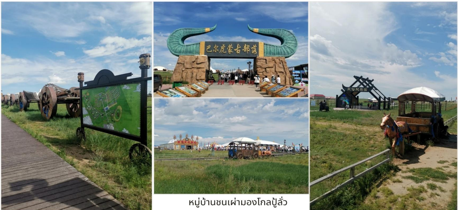
หมู่บ้านชนเผ่ามองโกลปู๊ ล้ว

นำท่านชม หมู่บ้านชนเผ่ามองโกลปู๊ ล้ว (蒙古部落 - Mongol Buluo) ชนเผ่าเร่ร่อนมองโกเลียสืบทอดวิถีชีวิตแบบดั้งเดิมมาหลายพันปี พวกเขาจะย้ายถิ่นฐานตามฤดูกาล และเลี้ยงสัตว์เป็นอาชีพหลัก (ม้า แกะ แพะ วัว และอูฐ) ใช้ชีวิตโดยการพึ่งพาธรรมชาติ ในฤดูใบไม้ร่วงระหว่างเดือนกันยายนถึงพฤศจิกายน พวกเขาจะย้ายลงมาสู่พื้นที่ที่มีที่กำบังลม เตรียมอาหารสำรองสำหรับฤดูหนาว และซ่อมแซมเกออร์รวมถึงอุปกรณ์ต่างๆ เมื่อเข้าสู่ฤดูหนาวในช่วงเดือนธันวาคมถึงกุมภาพันธ์ ชาวมองโกเลียจะตั้งถิ่นฐานในหุบเขาที่มีที่กำบัง ใช้เวลาในการดูแลสัตว์อย่างใกล้ชิดและทำงานหัตถกรรมในร่ม