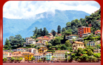
ชมวิวดอย ทะเลสาบโคโม