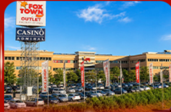
ฟ็อกซ์ทาวน์ ไอทาลี