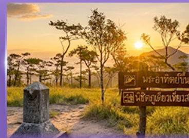
ชมพระอาทิตย์ขึ้น กุสอยดาว