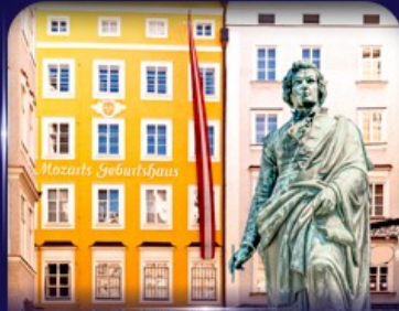
บ้านเกิดโมซาร์ท ซาลซบูร์ก