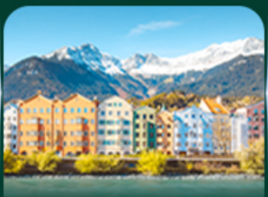
วาการ์สึลูกวาด อันส์บรุค