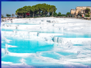
ปราสาทบุนยัฒย บามุกคาลา

OPTION JEEP SAFARI นั่งจี๊ปชมวิวกัปปาโดเกีย