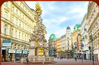
คาร์ทเนอว์ สตรีท ออสเตรีย