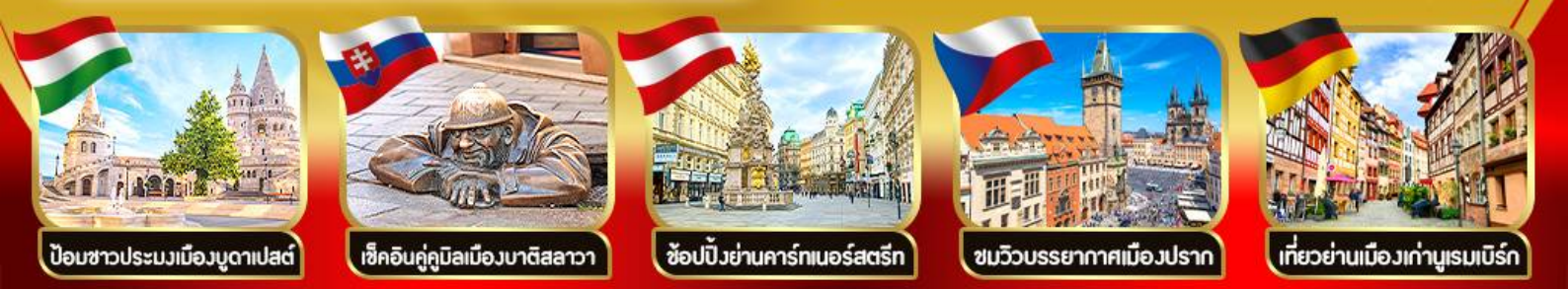
ปิอชชาวประมงเมืองบูดาเปสต์