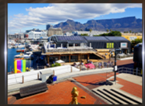
ท่าเรือ V&A waterfront