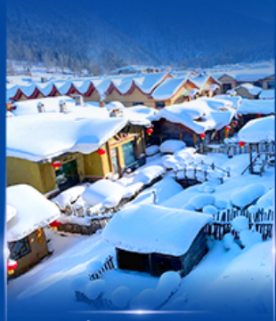
หมู่บ้านหิมะ สโนว์ทาวน์