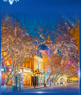
ย่านจงหยาง สตรีท