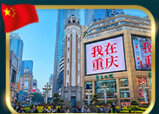
ถนนคนเดินเจียวฟางเป่ย์