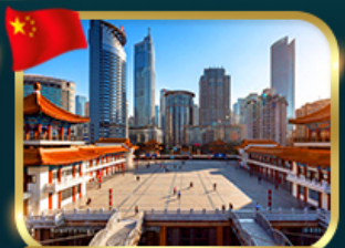
เข็คอินตึกไคว่ซังโหล