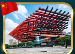
แลนด์มาร์กจั๊ว ตึกตะเกียบ