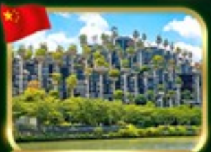
อาคาร 1,000 trees