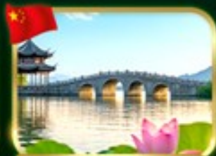
เที่ยวชมวิวทะเลสาบซีหู